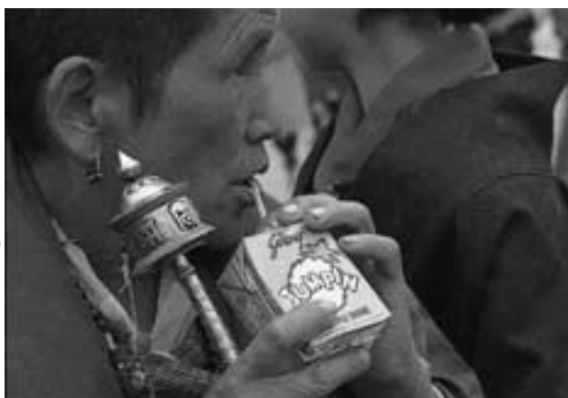
Een vrouw in Bhutan

Ook over de financiën van de dov zijn uiteraard afspraken gemaakt. Alle landen dragen naar vermogen hun steentje bij aan de uitvoering van de dov maar de 'incremental' kosten zouden voor rekening komen van Nederland. Dat komt in de praktijk neer op ongeveer 40 miljoen gulden per jaar, waarbij het overgrote deel van de Minister voor Ontwikkelingssamenwerking afkomstig is. Het Ministerie van vrom levert een bijdrage voor activiteiten binnen Nederland.