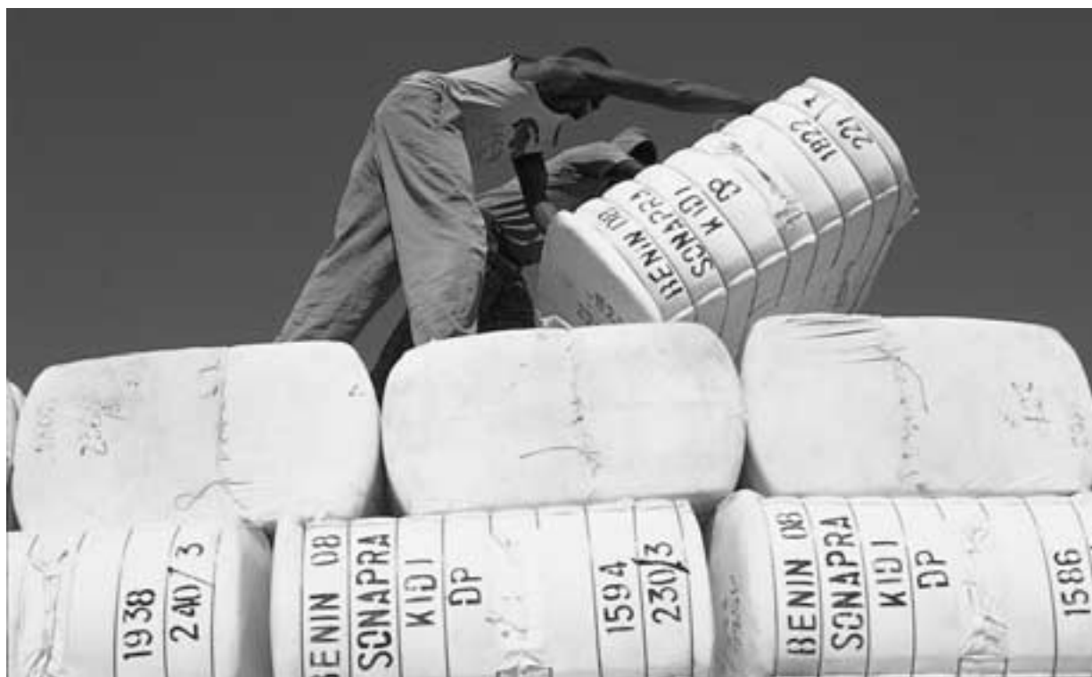
Katoen is het belangrijkste export product uit Benin